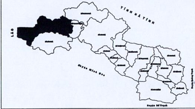
SƠ ĐỒ VỊ TRÍ XÃ THANH HÓA TRONG HUYỆN TUYỀN HÓA