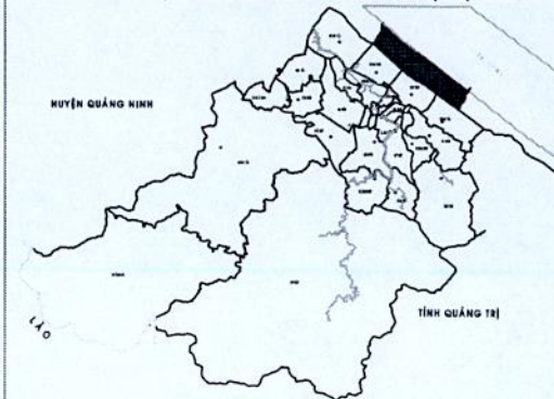
SƠ ĐỒ VỊ TRÍ XÃ NGƯ THỦY BẮC TRONG HUYỆN LỆ THỦY